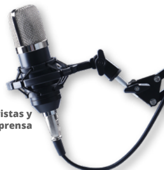
Entrevistas y artículos en prensa