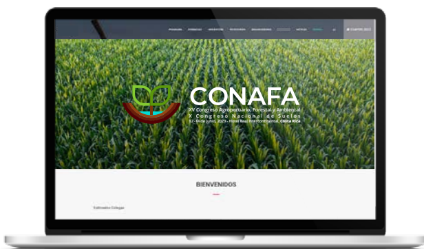
Web específica del Congreso