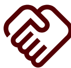
Medios de organismos aliados