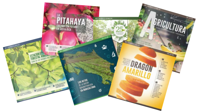
Emailing a más de 75.000 contactos de América Latina